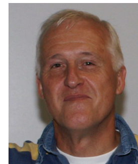
Réserve Raymond FOURNEAUX